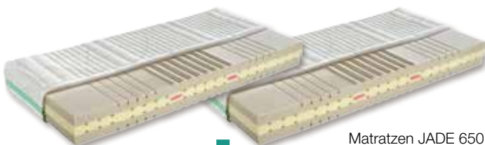
Matratzen JADE 650

Reinere Ausblasluft als die Raumluft, die Sie atmen.